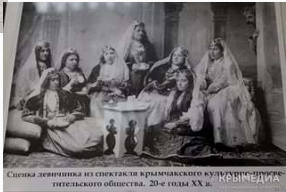
Сценка девицкинка из спектакля крымчаковского культурно-просветительского общества, 20-е годы XX в.

Внешне национальный костюм крымчаков похож на национальные костюмы крымских татар и караимов.